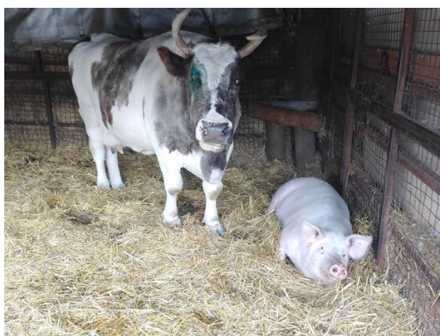
Loulou und die alte Luga