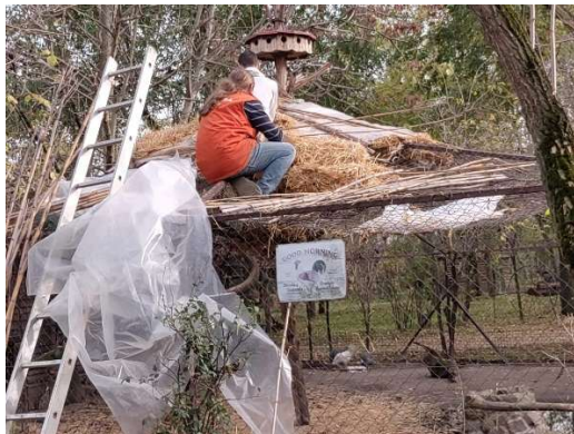
Ein undichtes Strohdach flicken, ständig gibt es zu tun

40 Jahre sind vergangen und viele Tiere sind zu uns auf den Hof gekommen, weiter gegangen ins neue, gute Leben oder bei uns gestorben.