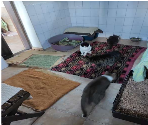
Winterquartier unserer Katzen