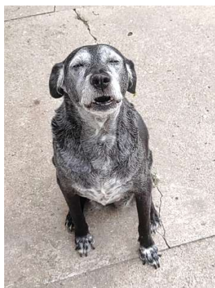
Vipi einer unserer ältesten Hunde

Viele der Hunde waren nicht plazierbar, zu alt, kaputt, verletzt, invalid, aggressiv (verständlich), hässlich, usw. Es gab eine Zeit da wir über 80 Hunde hatten, welche permanent bei uns blieben. Das ist eine grosse Zahl und Bürde in jeglicher Hinsicht.