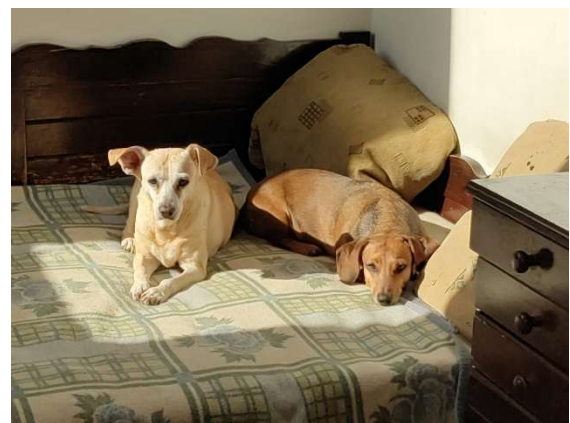
Die 20-jährige Grumpi mit ihrer 10-jährigen Kollegin Mandy. Nach fast 20 Jahren beisst sie immer noch

Die Vorbereitung der Tiere war früher viel normaler und einfacher, ein paar Impfungen, Kastration, eine Wurmkur. Heute ist es eine künstlich aufgeblasene, komplizierte, teure Prozedur, welche zu nichts dient ausser allen das Leben schwer zu machen und viel Geld irgendwo bei den verschiedenen Behörden in Serbien und im Ausland liegen zu lassen. Vor allem für die serbischen Tierschutztiere ist alles gut genug, um ihnen