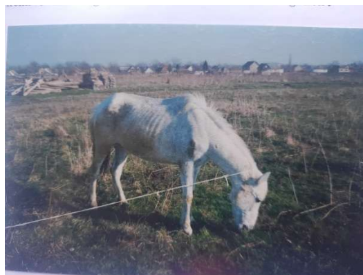
So sahen viele Pferde aus

Wir haben immer noch zwei alte Zigeunerpferdchen, welche sich nach Jahren bei uns noch sehr ungern anfassen lassen.