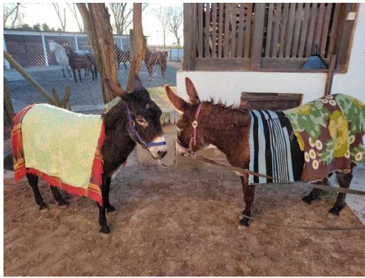
Shona und Shana die zwei alten Esel am ersten Tag bei uns