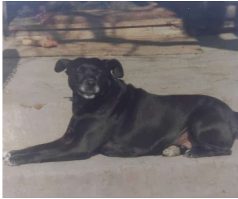
Gara (Foto 1986)

Den Schock, welchen ich in einem halben Tag meiner Ankunft erlebte, kann man eigentlich nicht beschreiben.